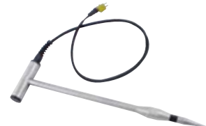
GSF 50TF (110 cm) Art.-Nr. 601312 GSF 50TFK (43 cm) Art.-Nr. 601313 Materialfeuchte-Einstechfühler, mit Temperatursensor zur Messung in Messtiefen bis 40 cm bzw. 107 cm, inkl. 1 m Anschlusskabel Geeignet für: Hackschnitzel, Holzwolle, Holzspäne, Stroh, Heu, Getreide, Sägemehl, etc.