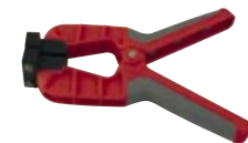
GMZ 38* Art.-Nr. 605783 Holzfeuchtemesszange, für Messung an Funieren und dünnen Hölzern (bis ca. 10 mm)