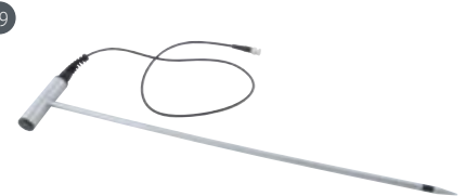
GSF 40 (67 cm) Art.-Nr. 601316 Materialfeuchte-Einstechfühler, (ohne Temperatursensor) zur Messung in gepressten Ballen in 60 cm Tiefe, inkl. 1 m Anschlusskabel. Geeignet für: Gepresste Heu- und Strohballen, Getreide

*Messkabel GMK 38 erforderlich für GHE 91, GSE 91, GSG 91, GST 15B / 25B / 40B, GBSK 91, GBSL 91, GEF 38, GSP 91, GMZ 38