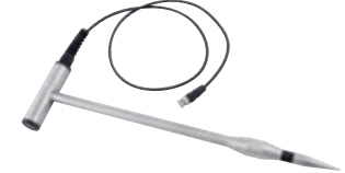
GSF 50 (110 cm) Art.-Nr. 601305 GSF 50K (43 cm) Art.-Nr. 601308 Materialfeuchte-Einstechfühler, (ohne Temperatursensor) zur Messung in Messtiefen bis 40 cm bzw. 107 cm, inkl. 1 m Anschlusskabel. Geeignet für: Hackschnitzel, Holzwolle, Holzspäne, Stroh, Heu, Getreide, Sägemehl, etc.