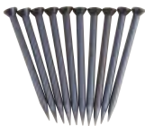
GST 91/40 Art.-Nr. 601275 Stahlstifte 10 Stahlstifte, 40 mm lang, Ø 2,5 mm, in Plastikdose