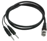
GMK 38 Art.-Nr. 601261 Messkabel, BNC auf 2x Bananenstecker