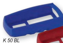
K 50 BL