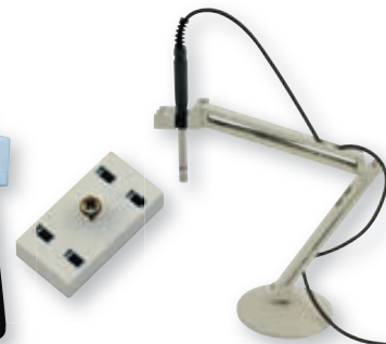
GEH 1 mit Fühler